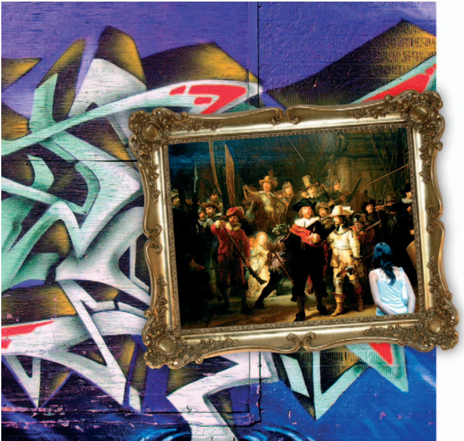
Hollandse meesters zijn wereldwijd beroemd