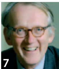
VAN DE VOORZITTER