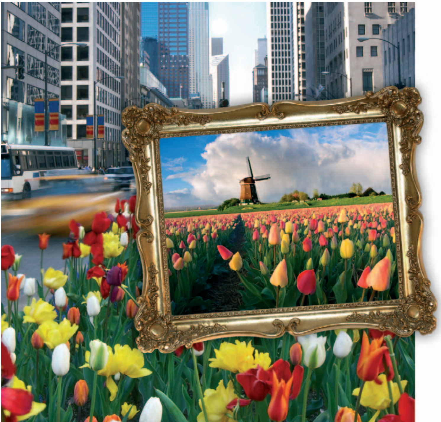
Hollandse tulpen: ook volop aanwezig in New York