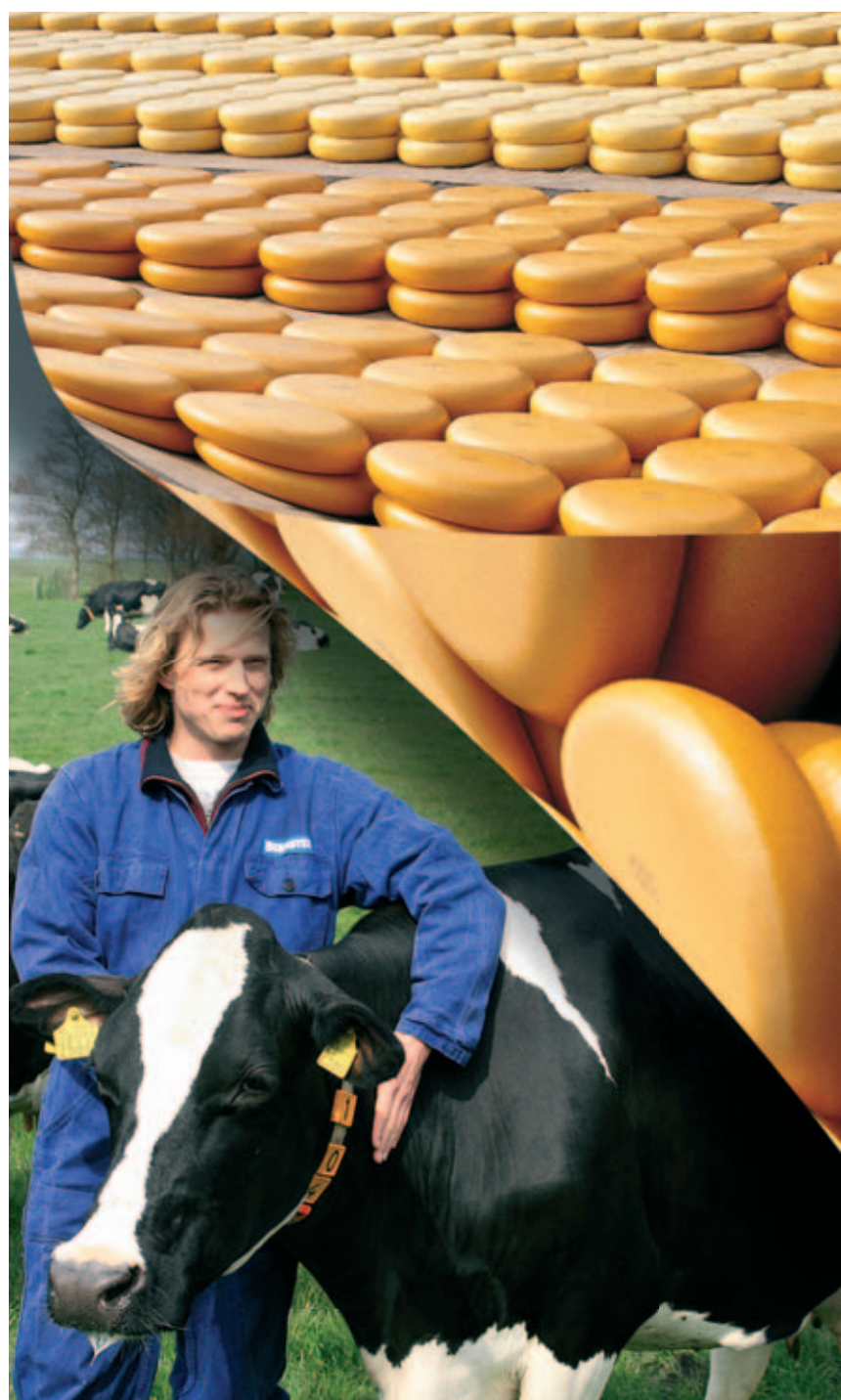
Nederlandse koeien en smakelijke kaas: belangrijke exportproducten