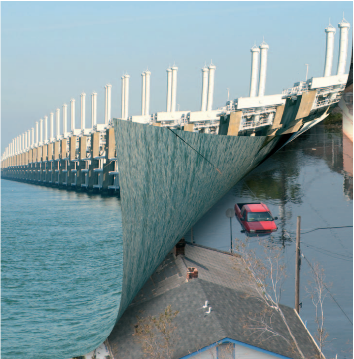
Kennis van het Nederlandse bedrijf Arcadis draagt bij aan het voorkomen van nieuwe overstromingen in New Orleans