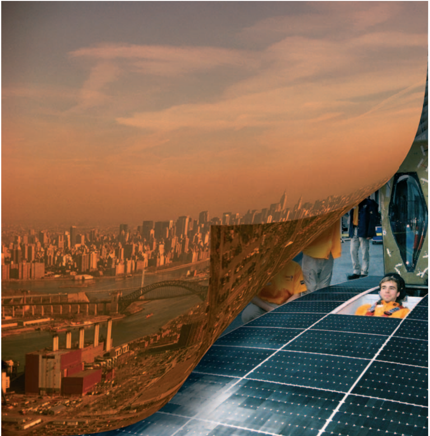
De Nuon Solar auto draagt bij aan een schoner milieu