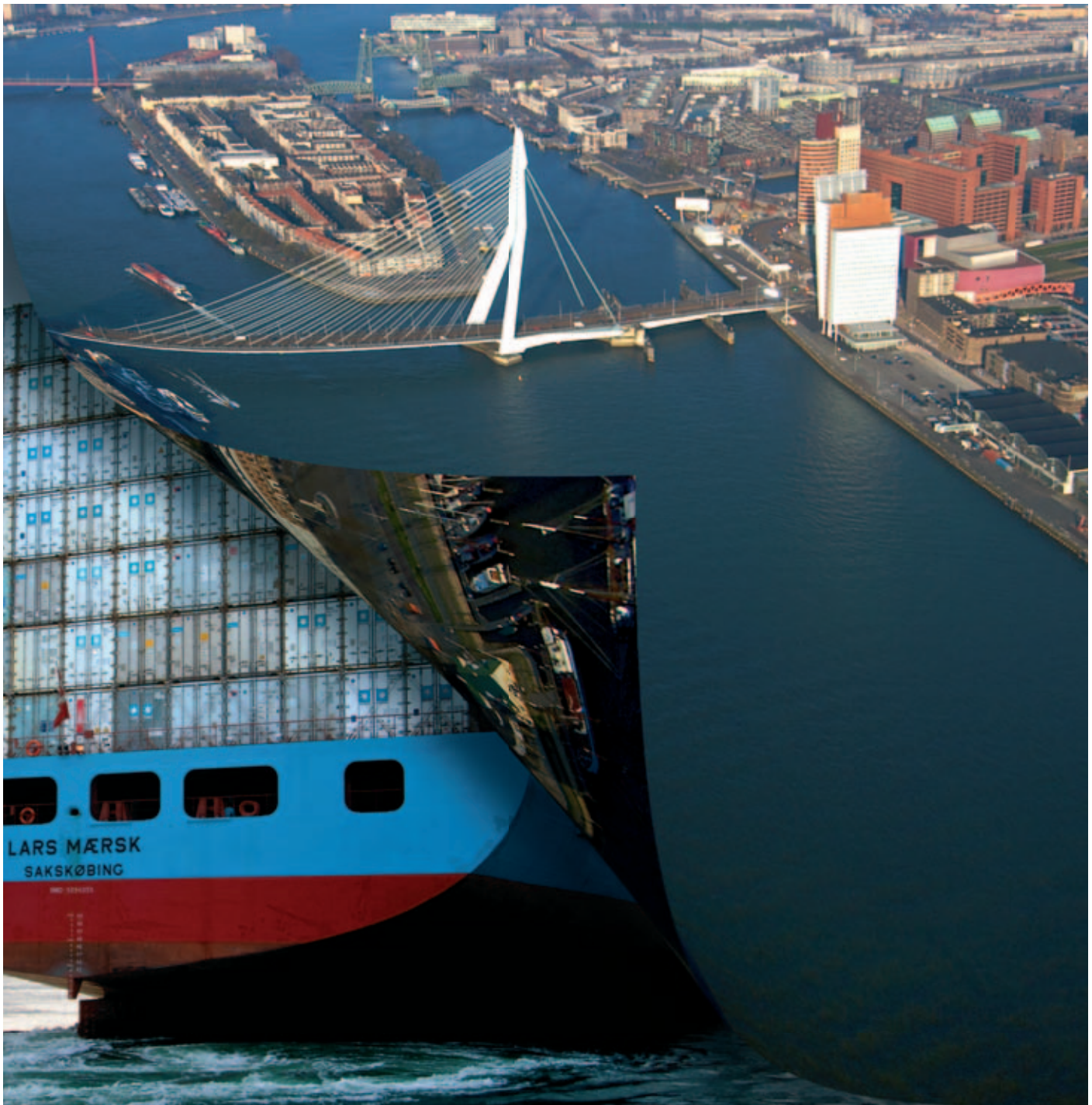
De Rotterdamse haven: toegangspoort tot Europa