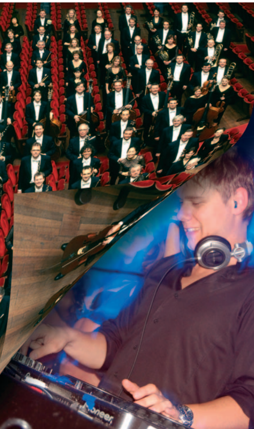
Nederlandse muziek is overal ter wereld te horen