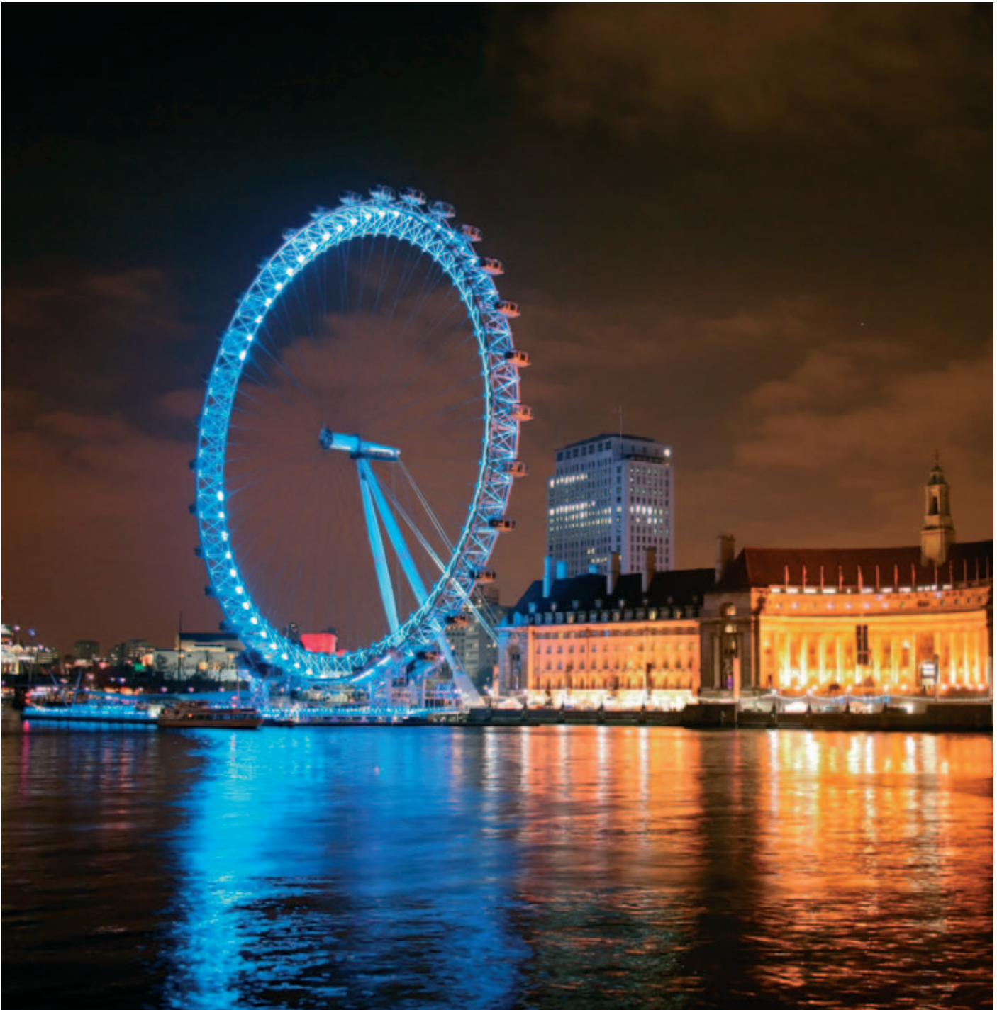
De London Eye werd gebouwd door het Nederlandse bedrijf HGG Profile Equipment