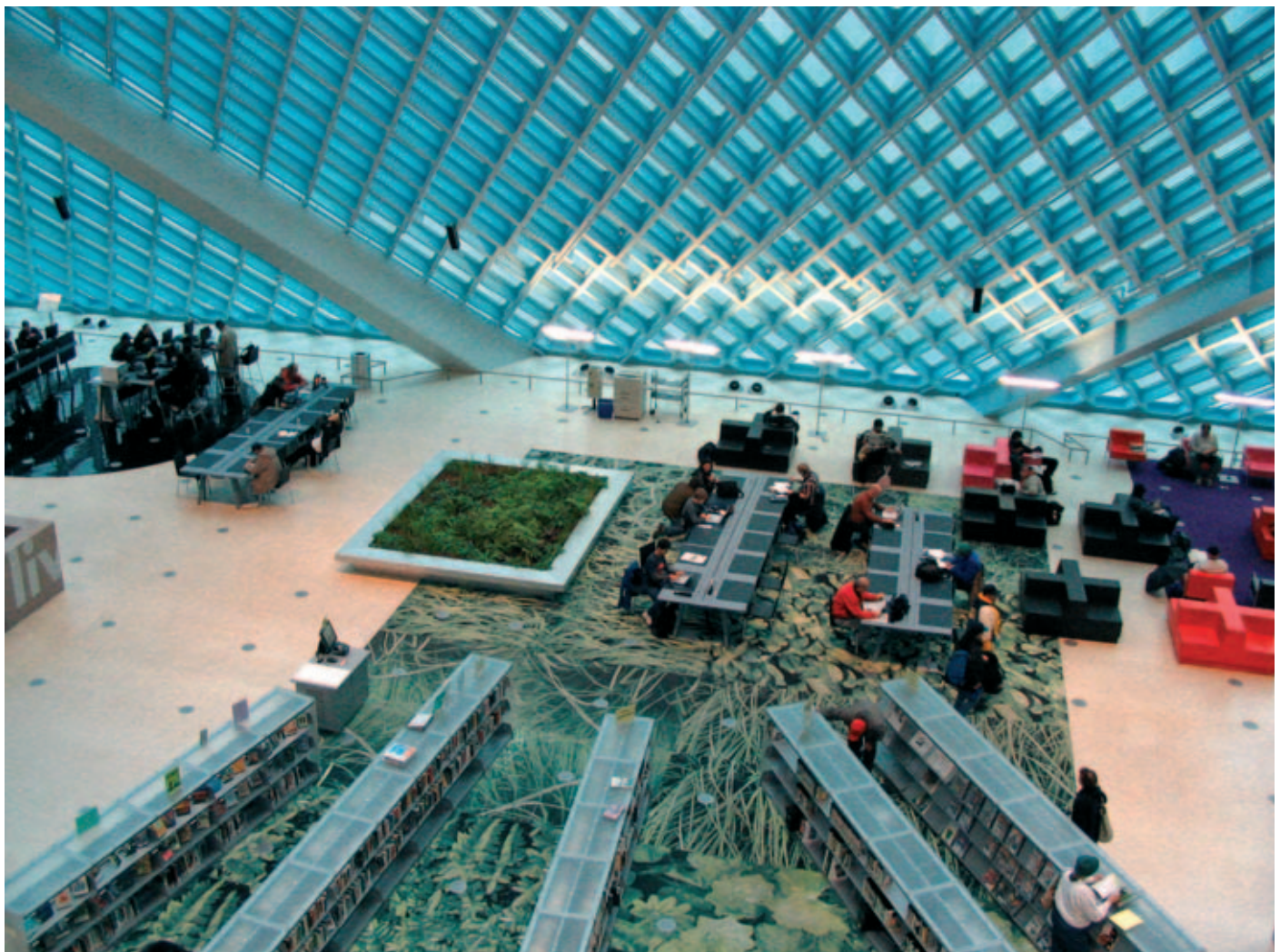
Openbare bibliotheek in Seattle gebouwd naar ontwerp van Rem Koolhaas