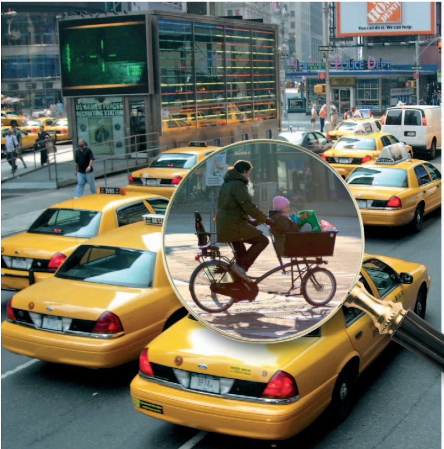
Hollandse oplossing voor het drukke stadsverkeer