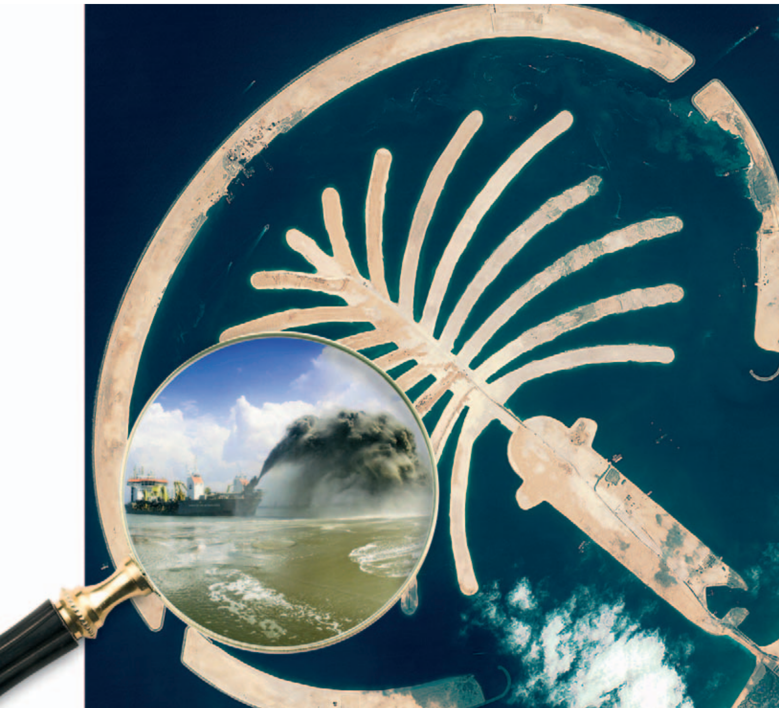
Het Palmeneilandrijk voor de kust van Dubai werd opgespoten door onder meer het Nederlandse bedrijf Van Oord Vorige pagina: Hét entertainment exportproduct van Nederland: André Rieu