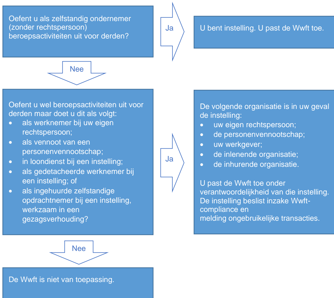
Afbeelding 3: Beslisboom wie de Wwft moet toepassen

De 'instelling' moet de Wwft toepassen. 82 De verplichtingen volgens de Wwft rusten namelijk op de instelling 83 en niet op individuele belastingadviseurs en accountants. Zie paragraaf 3.3 voor een toelichting op het begrip instelling. Daar worden ook de hierna gebruikte begrippen 'zelfstandig onafhankelijk' en 'beroepsactiviteiten' toegelicht. Hieronder staat een beslisboom (Afbeelding 3). Aan de hand daarvan kunt u bepalen of de Wwft van toepassing is en wie de Wwft moet toepassen.